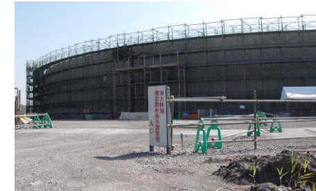
製鉄会社 排水タンク外面防食