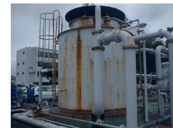
発電所設備 腐食防止