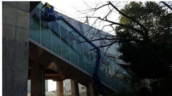
施工状況 窓ガラス外部側 (撥水加工)