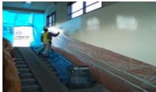
駅施設・空港施設等